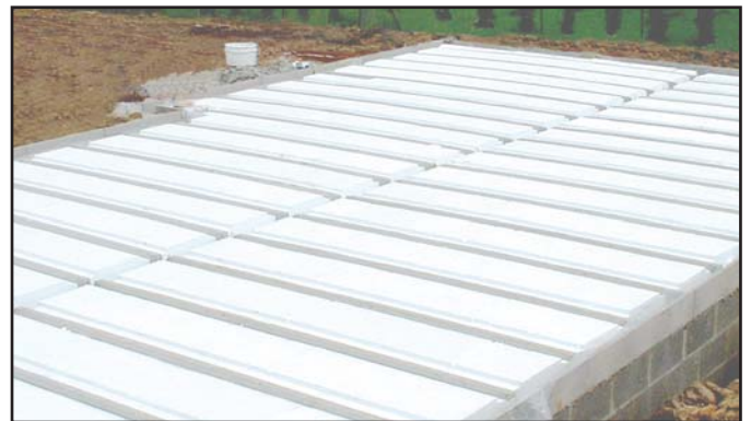
Plancher vide sanitaire à entrevous Polyseac

➔ Étalement : nous conseillons vivement la pose de plancher sans étais en vide sanitaire. En cas d'étalement, il faut répartir la charge sur plusieurs étais larges ou aller chercher le talon des poutrelles (la languette polystyrène sous la poutrelle n'a pas de résistance suffisante à la compression).