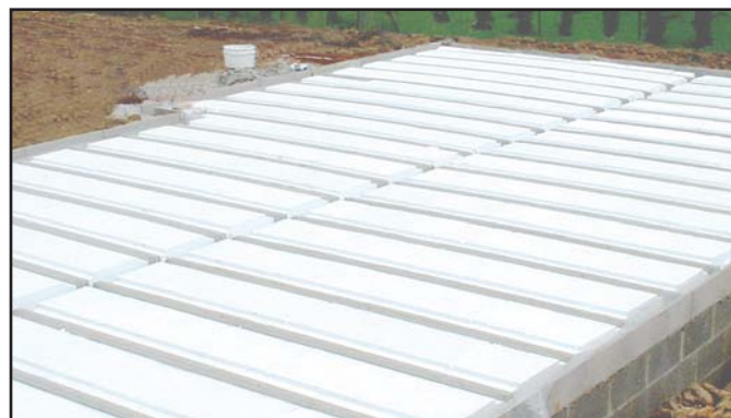
Plancher vide sanitaire à entrevous Polyseac

➔ Etalement : nous conseillons vivement la pose de plancher sans étais en vide sanitaire. En cas d'étalement, il faut répartir la charge sur plusieurs étais larges ou aller chercher le talon des poutrelles (la languette polystyrène sous la poutrelle n'a pas de résistance suffisante à la compression).